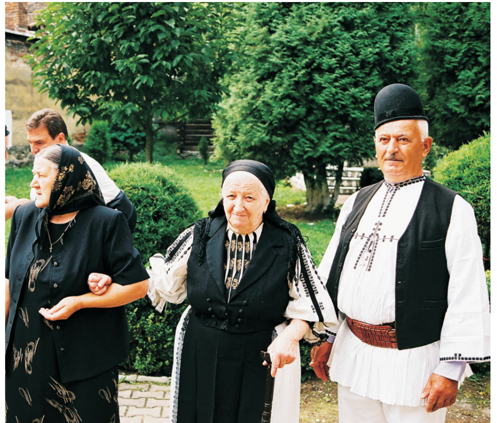
Remember 2013 - 2014